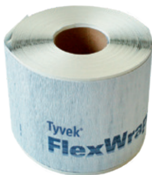
Délka: 23 m Šířka: 15 cm

Flexibilní vysoce výkonné pásy pro vzduchotěsné a vodotěsné utěsnění prostupů ve střeše, stropu a stěnách