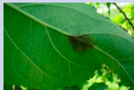
Počáteční příznaky napadení strupovitostí na rubu listu