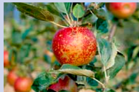
Příznaky napadení padlí na plodech